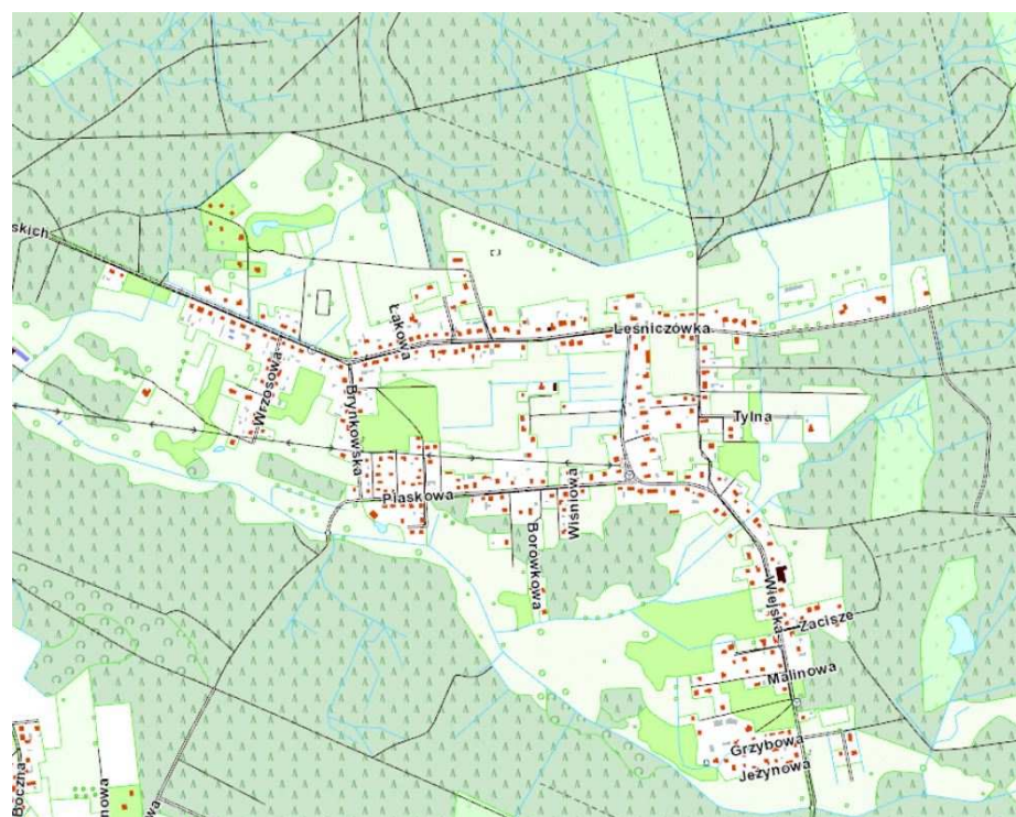
Rys. Mapa obszaru objętego projektem planu miejscowego.

Teren objęty opracowaniem obejmuje zurbanizowany obszar miejscowości Nowa Wieś Tworska. Całość ze wszystkich stron otoczona jest lasem. Zabudowa koncentruje się wzdłuż istniejących dróg. Od południa na granicy opracowania przepływa ciek Blaszyńówka, „obudowany” łąkami. W obszarze zabudowanym mamy do czynienia przede wszystkim z budynkami mieszkalnymi jednorodzinnymi oraz budynkami letniskowymi. Zabudowa usługowa zlokalizowana jest w większości w parterach budynków mieszkalnych. W obszarze opracowania brak jest działalności produkcyjnych.