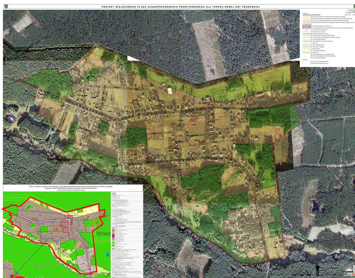
Rys. Prognoza oddziaływania na środowisko – rysunek. (pomniejszenie bezskalne)

Projekt planu oraz prognoza oddziaływania na środowisko ustalają zasady i wskazują sposoby zagospodarowania, których realizacja jest pożądana ze względu na możliwość niwelowania (neutralizowania) negatywnych skutków działań albo też niepożądana z uwagi na możliwość kumulowania się (wzmacniania) negatywnych skutków realizacji działań związanych z funkcjonowaniem kopalni.