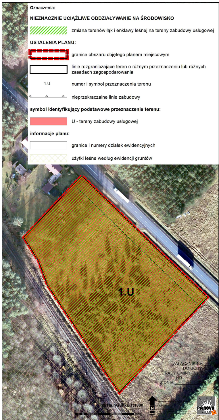
Rys. Prognoza oddziaływania na środowisko – rysunek. (pomniejszenie bezskalne)